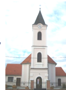
crkva sv. Matije apostola