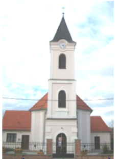
crkva sv. Matije apostola