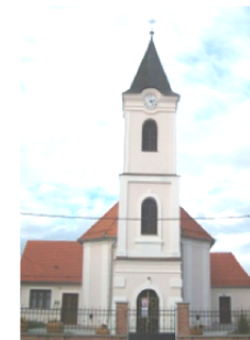
crkva sv. Matije apostola

Marija Pomoćnica, sv. Vinko Ler., Suzana