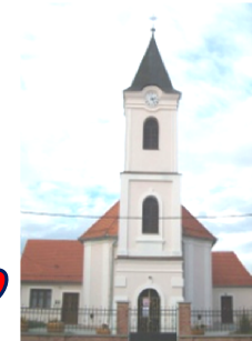
crkva sv. Matije apostola

Sveto Evanđelje po Ivanu Nedjeljna biblijska poruka (Iv 3,16-18) U ono vrijeme reče Isus Nikodemu: »Bog je tako ljubio svijet te je dao svoga Sina Jedinorođenca da nijedan koji u njega vjeruje ne propadne, nego da ima život vječni. Ta Bog nije poslao Sina na svijet da sudi svijetu, nego da se svijet spasi po njemu. Tko vjeruje u njega, ne osuđuje se; a tko ne vjeruje, već je osuđen što nije vjerovao u ime jedinorođenoga Sina Božjega.«