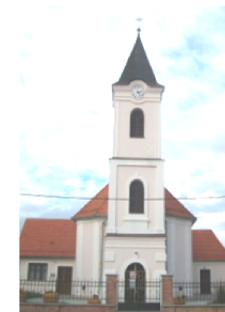
crkva sv. Matije apostola