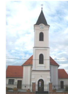
crkva sv. Matije apostola