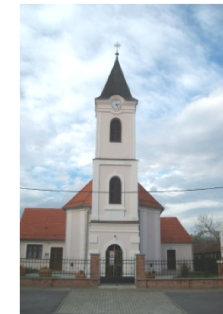
crkva sv. Matije apostola