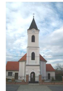
crkva sv. Matije apostola