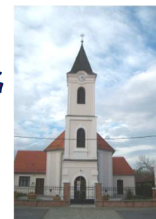
crkva sv. Matije apostola

17. siječanj - DRUGA KROZ GODINU sv. Antun, op. Nedjeljna biblijska poruka