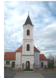
crkva sv. Matije apostola