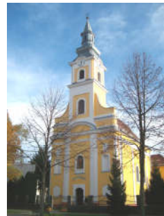
cr. Rođenja sv. Ivana Krstitelja