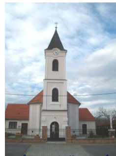
crkva sv. Matije apostola