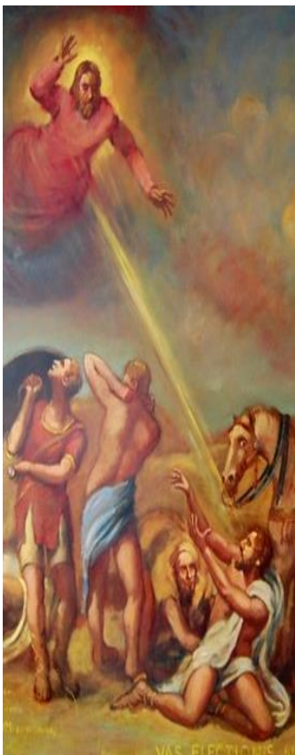
Obraćanje sv. Pavla

4. nedjelja kroz godinu, 31. 1. ----- - 9:30 h