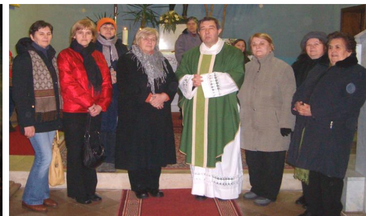
(proljeće 2013. g.)