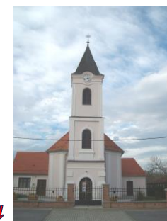
crkva sv. Matije apostola

Među ljudima prevladava mi-zvijezdama temeljno ljudsko životu vođeni, usmjeravani, a da Zacijelo, koji će smjer naš život inicijativi koju mi poduzimamo tijekom našega života događa, Zatekne nas. Primjerice, ljudski nismo planirali, jednostavno su se ima moć samoodređenja, ipak ne cu da smo u životu često bili života. Naša sloboda leži u tome kojemu se vodstvu povjeravamo, za koje smo vodstvo pozorni u životu. Zvijezda o kojoj izvještava evanđelje, simbol je Božjega vodstva. Znamo da su se ljudi stoljećima uz pomoć zvijezda orijentirali u mračnoj noći na svojim putovanjima i zvezdano nebo im je pomoglo da stignu do cilja putovanja. Zato je zvijezda simbol za iskustvo Božjega vodstva u životu, za sve one trenutke kada nam se u nekim događajima i susretima otvorio put. I tri su kralja bila vođena. Oni su slijedili zvijezdu i došli do mjesta rođenja Djeteta Isusa. U njemu prepoznali Boga. I pastiri su bili vođeni. Nisu spontano došli do mjesta rođenja. Čudo Božjeg vodstva na koncu ih je dovelo do vjere. Zbog toga je vjerniku zvijezda simbol Božjega vodstva. Osim našega ljudskoga traženja, postoji i Božje usmjeravanje. Bog nam ide ususret dok toga još nismo ni svjesni. Što znači vjerovati? Pristati na Božji put s nama. Ne znamo kamo sve put vodi, ali s povjerenjem u Božje vodstvo, putujemo korak po korak, iz dana u dan. Na našem putu potrebna nam je podrška bližnjih (zajednice), osobito danas kada su mnogi ostavljeni sami na svom putu.