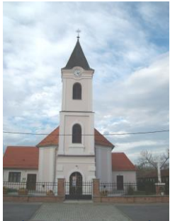
crkva sv. Matije apostola

„Ivan zaigra od radosti u utrobi utrobi svoje majke započinje onoga koji ima doći. I Elizabeta, spoznaje, da se njezin sin u utrobi već joj želi reći da Marija nije tek njoj, već je posjećuje Majka Mariju blaženom. Temelj njezina “Blažena ti što povjerala da će se Gospodina!” Ovdje imamo čašćenju Marije. Svi mi bi se vjere. Ali kako se vratiti u prostor biblijske vjere? Ima ljudi koji su cijeli život u crkvi, koji žive religioznom životom i još to nazivaju biblijskom vjerom, ali iz njih ne izvire snaga, vjera, optimizam. Oni žive svoje pozive, poštuju pravila, primaju sve sakramente, ali u njima nema biblijske vjere. Takva tobožnja vjera ometa pristup pravoj vjeri. Zbog toga je potrebno srušiti staru vjeru kako bi se mogla izgraditi nova, istinska vjera. Kriza vjere stoga može biti nešto u sebi pozitivno. Ona je čišćenje i odvikavanje od idolatrijske vjere i stvaranje ozračja u kojemu će se razvijati zrela vjera koja počiva na ljubavi, a ne na strahu ili na potrebi. Bog ne želi bilo kakvu vjeru, eto, mora postojati nešto, neki Bog, stvoritelj svega. Vjerujemo li u Boga koji je sada i ovdje osobna, stvarna, sveprožimajuća i djelatna snaga? Vjerujemo li da se on stvarno brine za nas, da stvarno vodi naš život? Toliko puta pjevamo u crkvi da je Bog naša snaga, utočište, utjeha, itd. Je li On to stvarno? U svakidašnjici? Na ulici, na radnom mjestu? Vjernik u biblijskom smislu vjeruje Bogu iznutra, osobno, i stavlja Boga na prvo mjesto i po cijenu velike žrtve u životu.